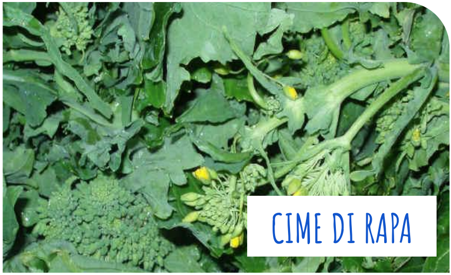
CIME DI RAPA